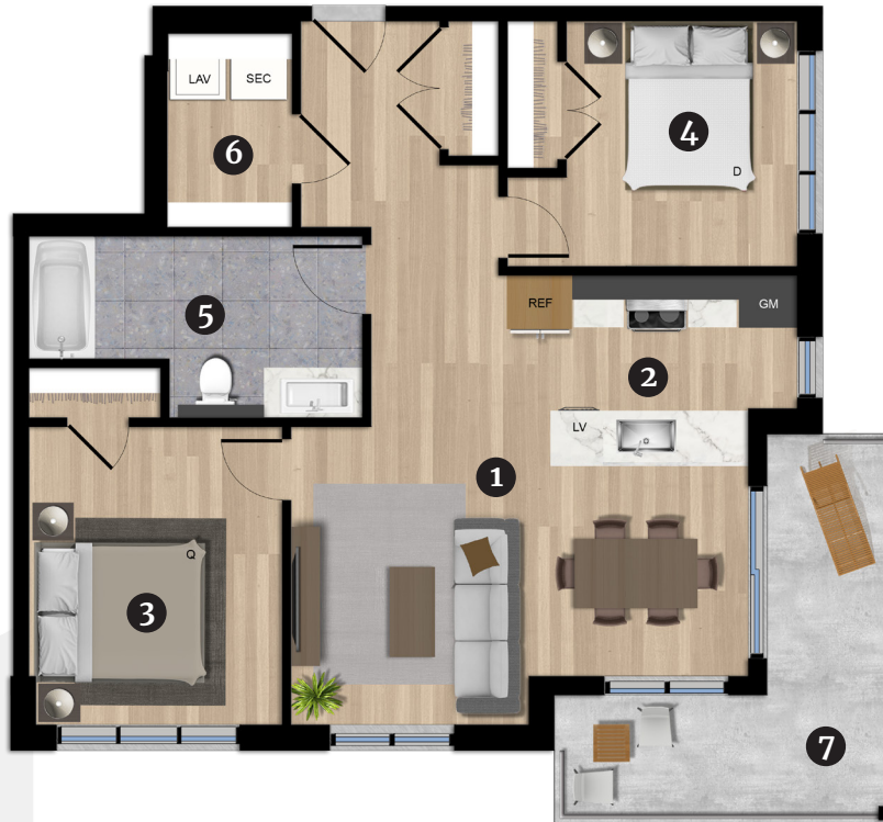
Bâtiment C 3e étage