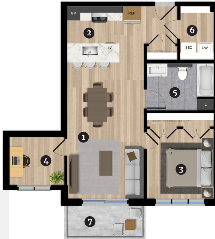
Bâtiment C 3e étage